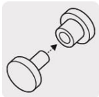
Cosido y remachado