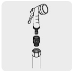
Conexión rápida y automática