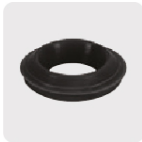
Empaque cónico antifuga